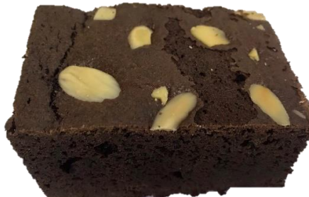
พบหน้าบราวน์ลอก

4. ลักษณะที่ ไม่สามารถยอมรับได้ (Rejected) (ต่อ)